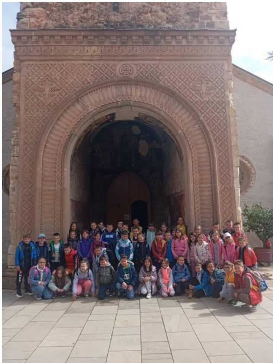
26. април – Изведена је екскурзија за ученике издвојених одељења. Посетили су Оплепац, Карађорђево градо, Рисовачку пећину и Буковичку бању.