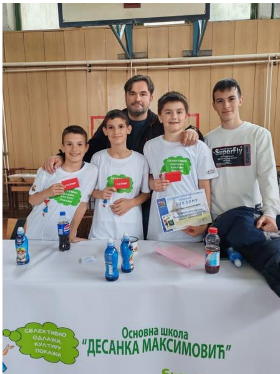
20 - 27. март – Ученици млађих разреда били су на рекреативној настави у Сокобањи.